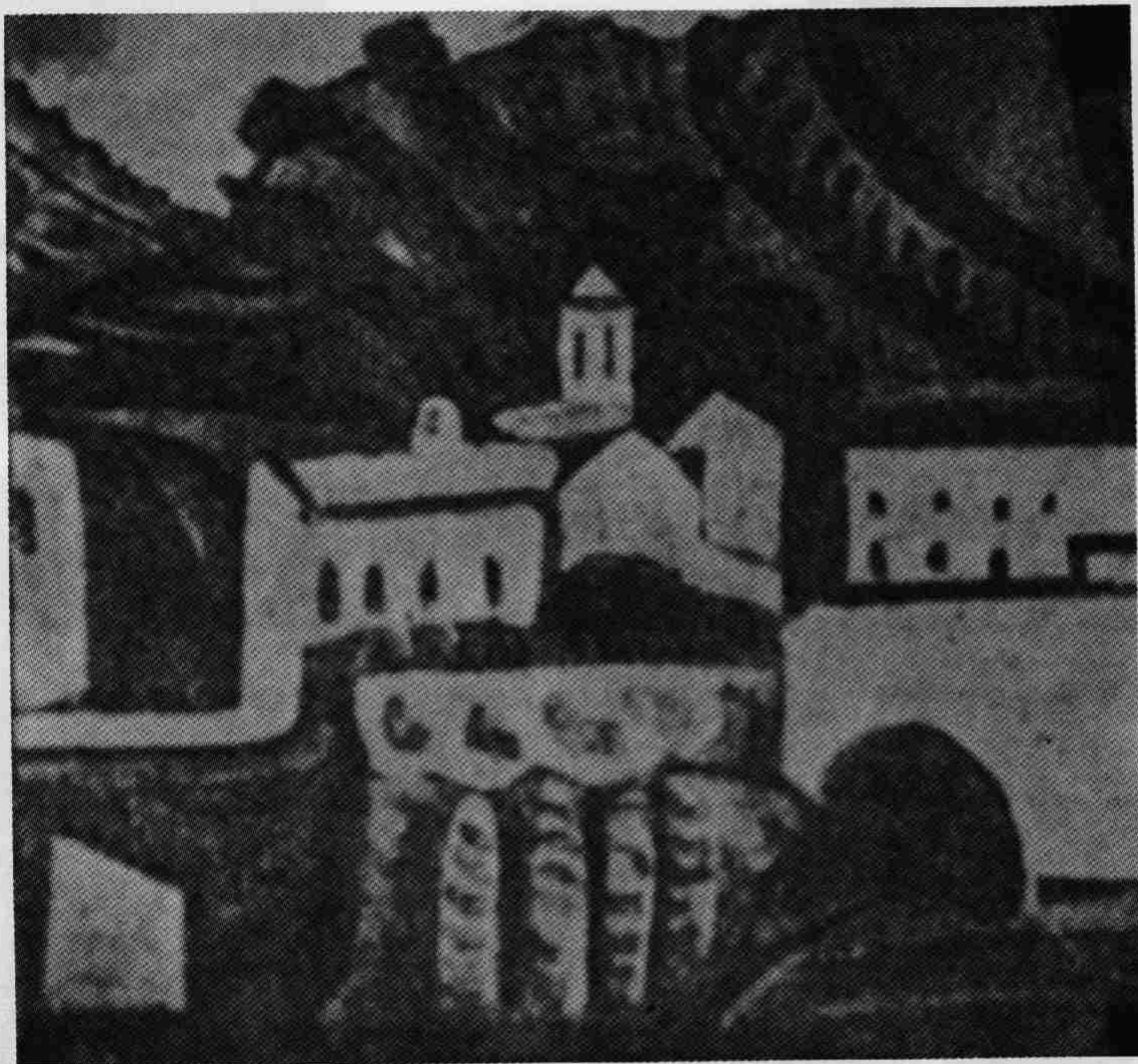
Κείμενο σελ. 6