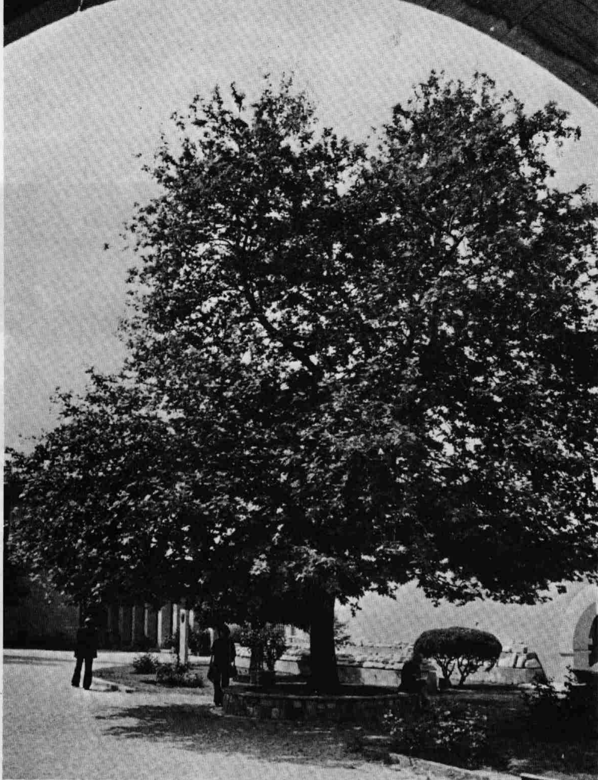
«Ὁ πλάτανος ORIENTALIS - τοῦ Βυζαντινοῦ μουσείου 1983».