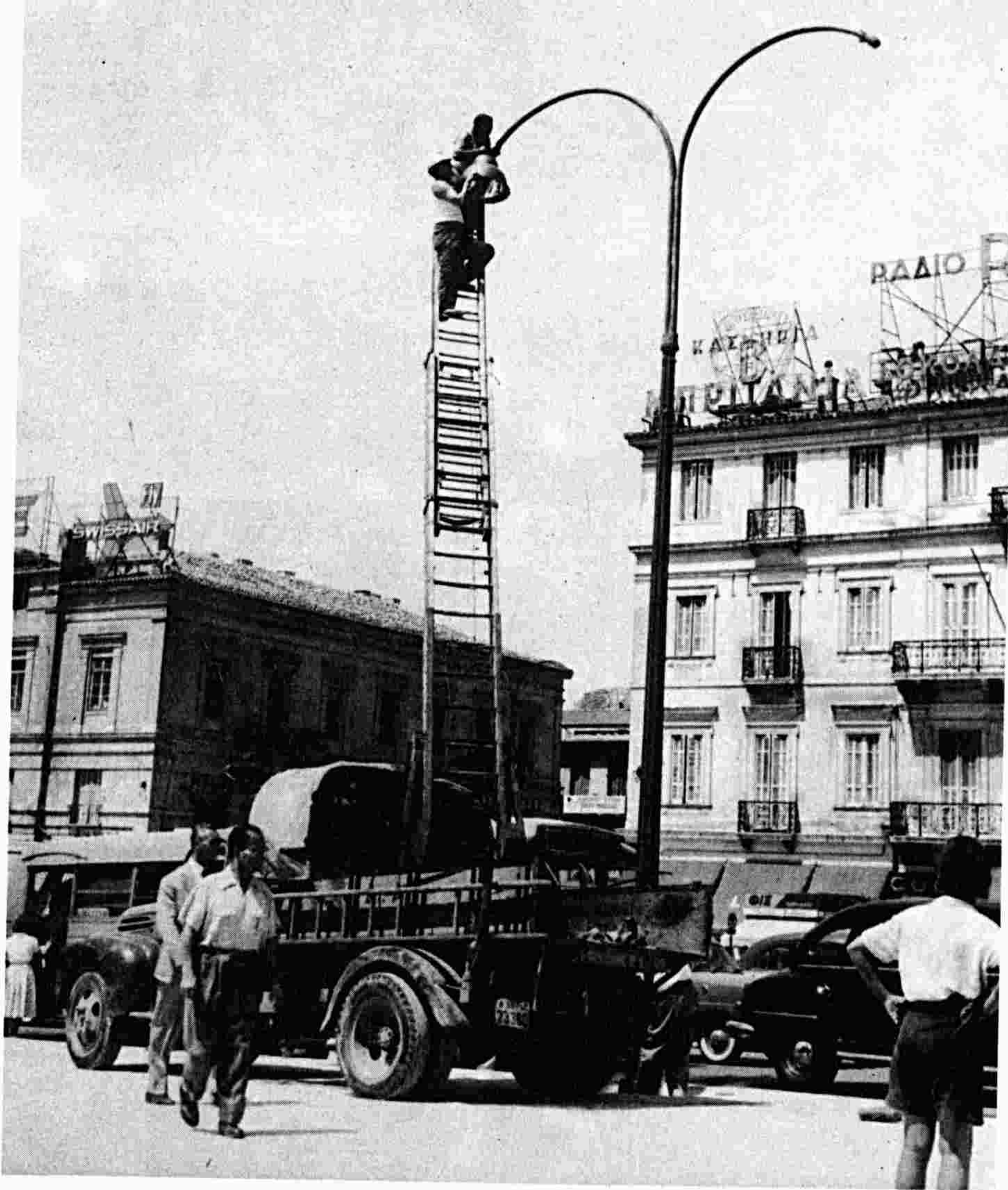
Σύνταγμα. Κάτω πλευρά