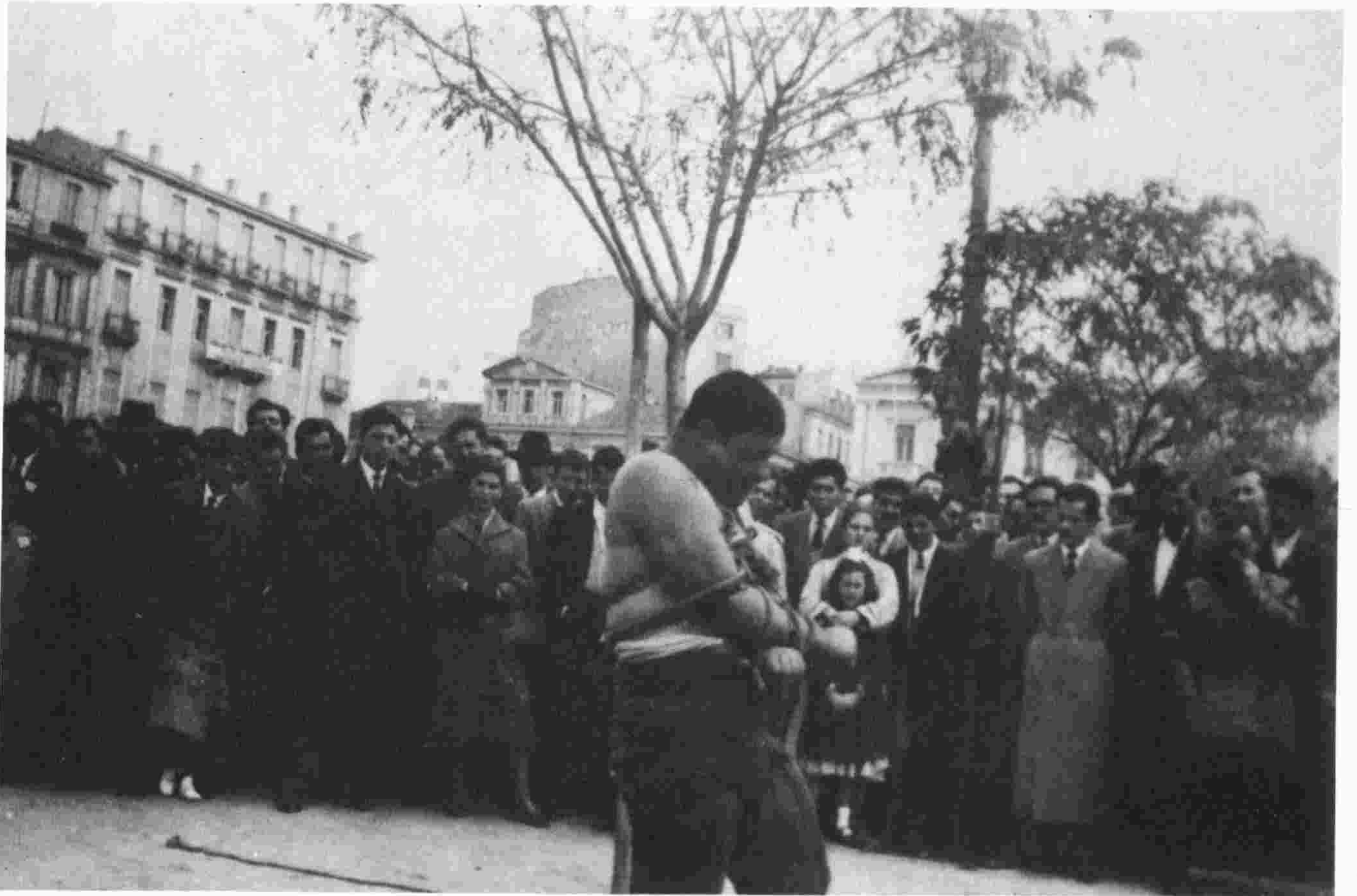
«ὁ νέος Κουταλιανός»