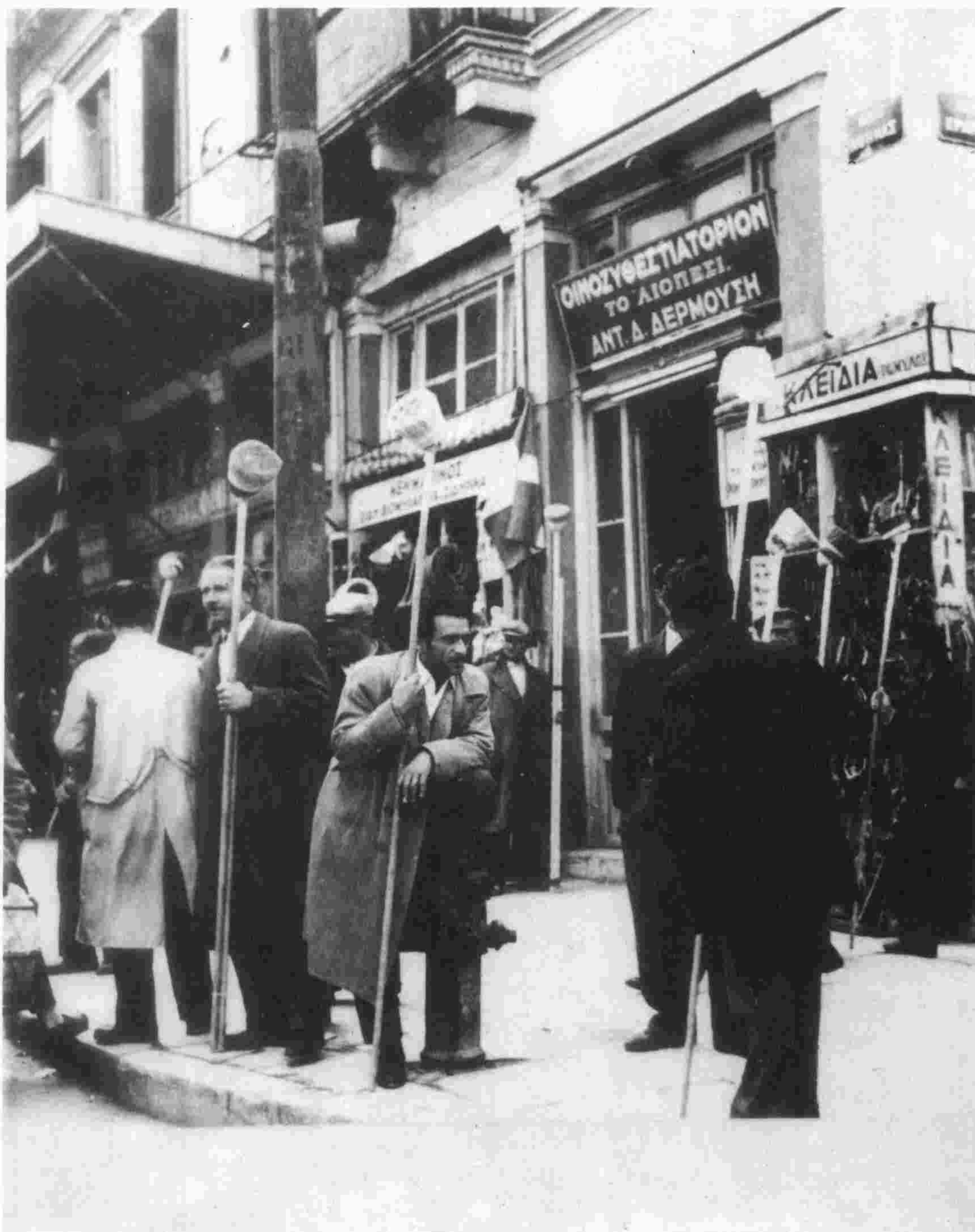
ασπριτζήδες περιμένουν πελατεία