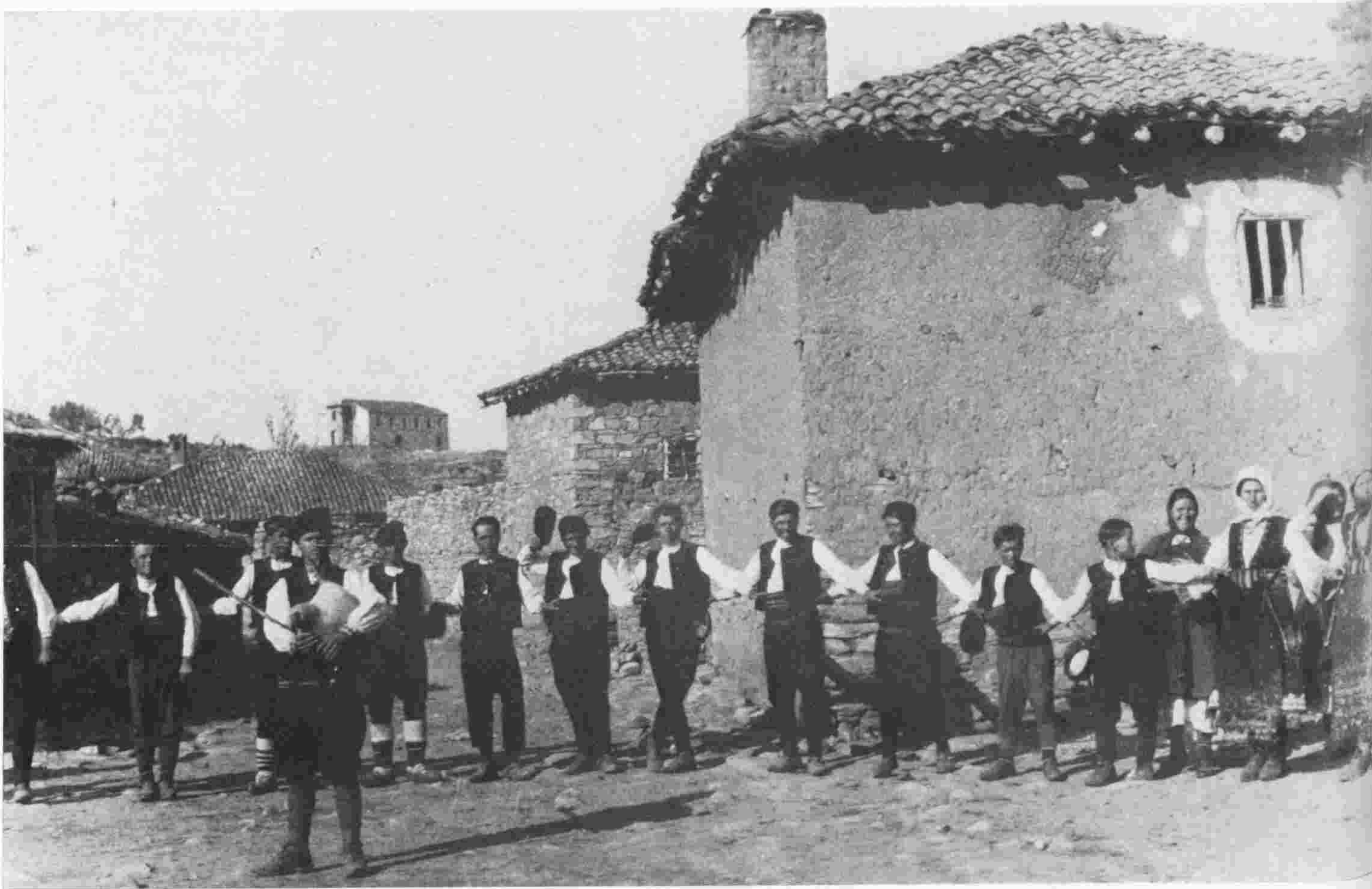
χορός τό Πάσχα, ΦΛΩΡΙΝΑ