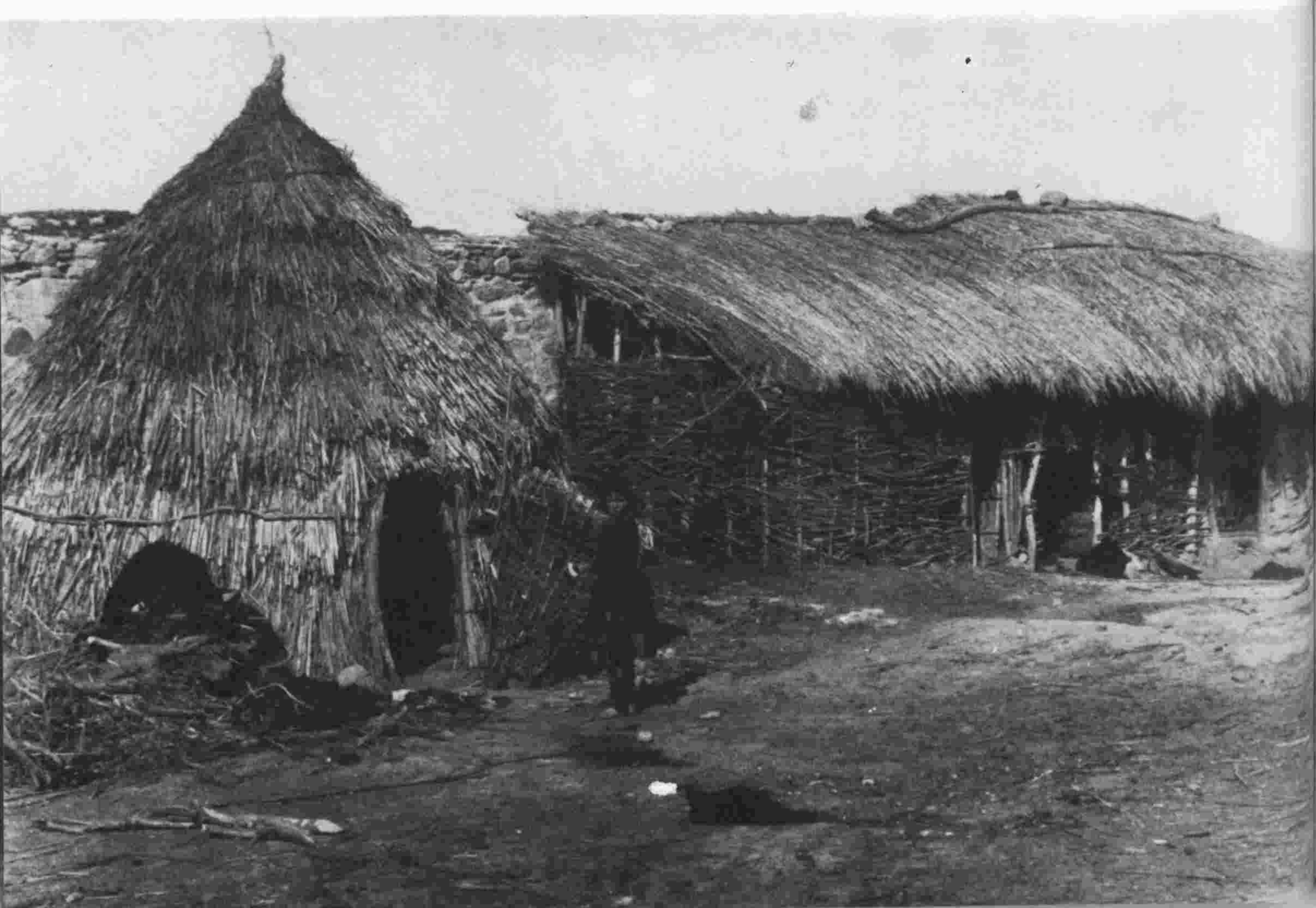
μόνιμα καλύβια Σαρακατσανέων