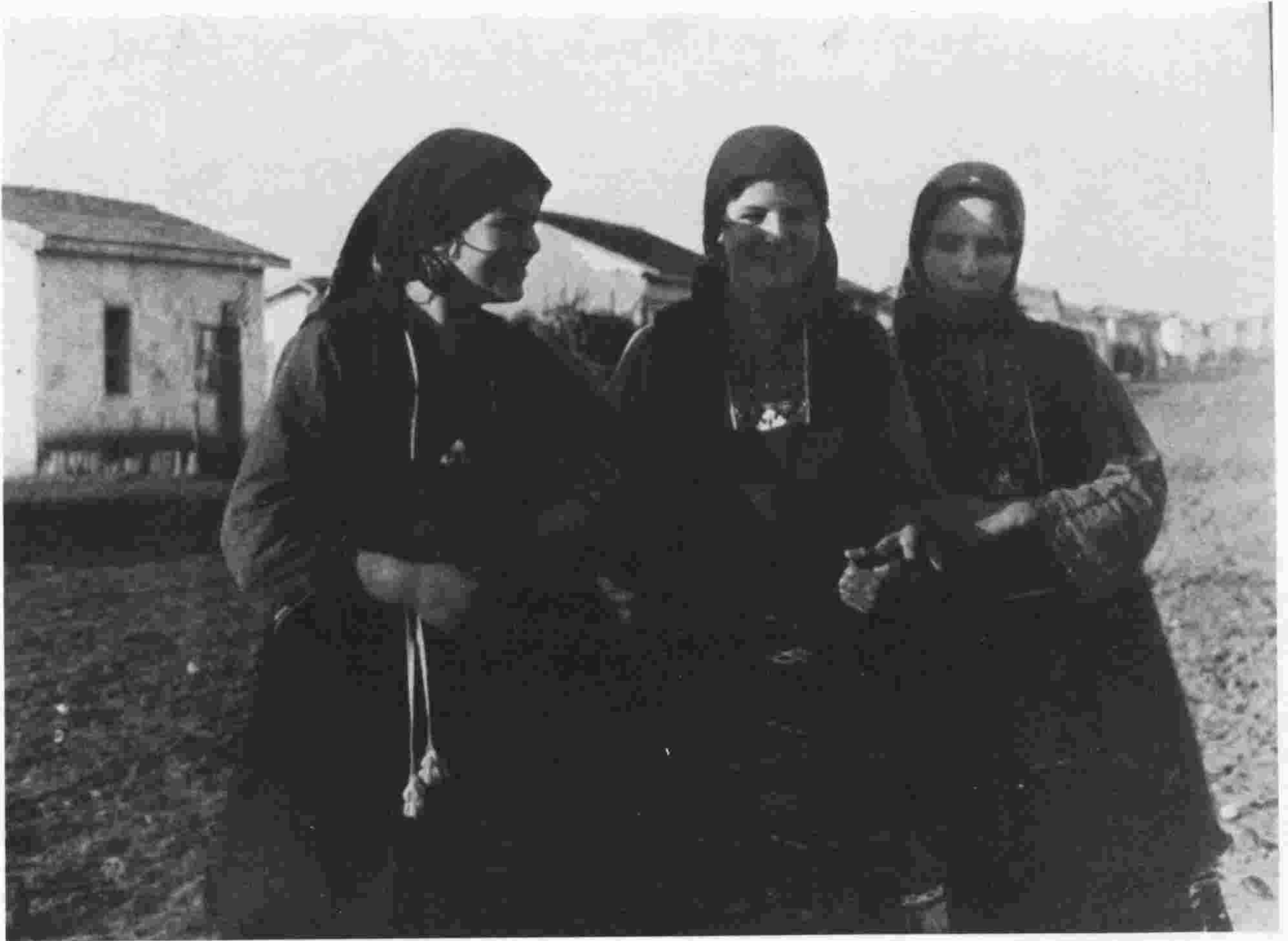
προσφυγοπούλες άπ' τήν άνατολική ΘΡΑΚΗ