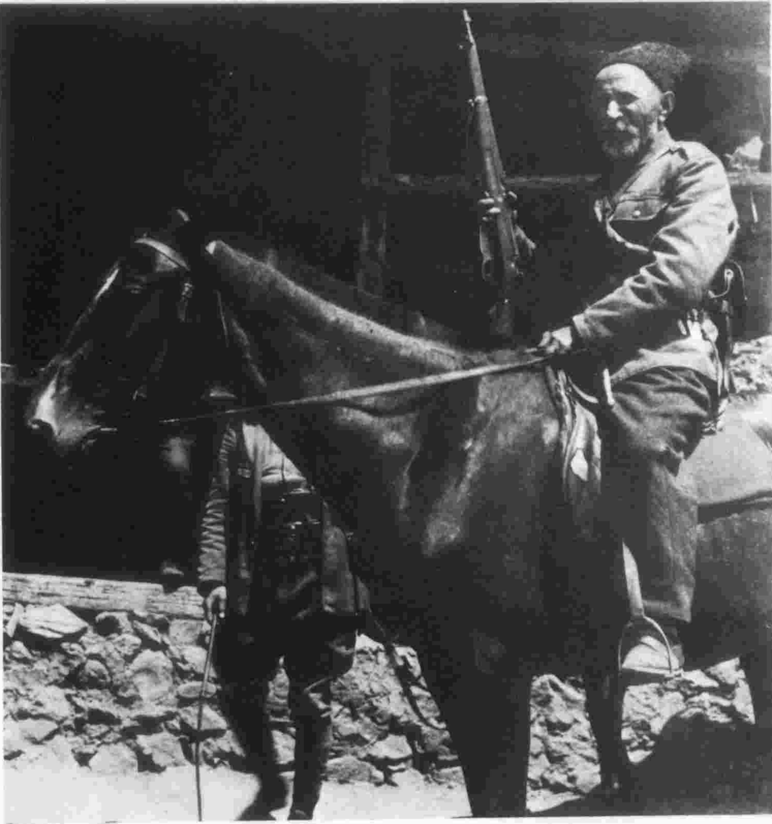
τσερκέζοι πρόσφυγες σέ παραμεθόρια περιοχή