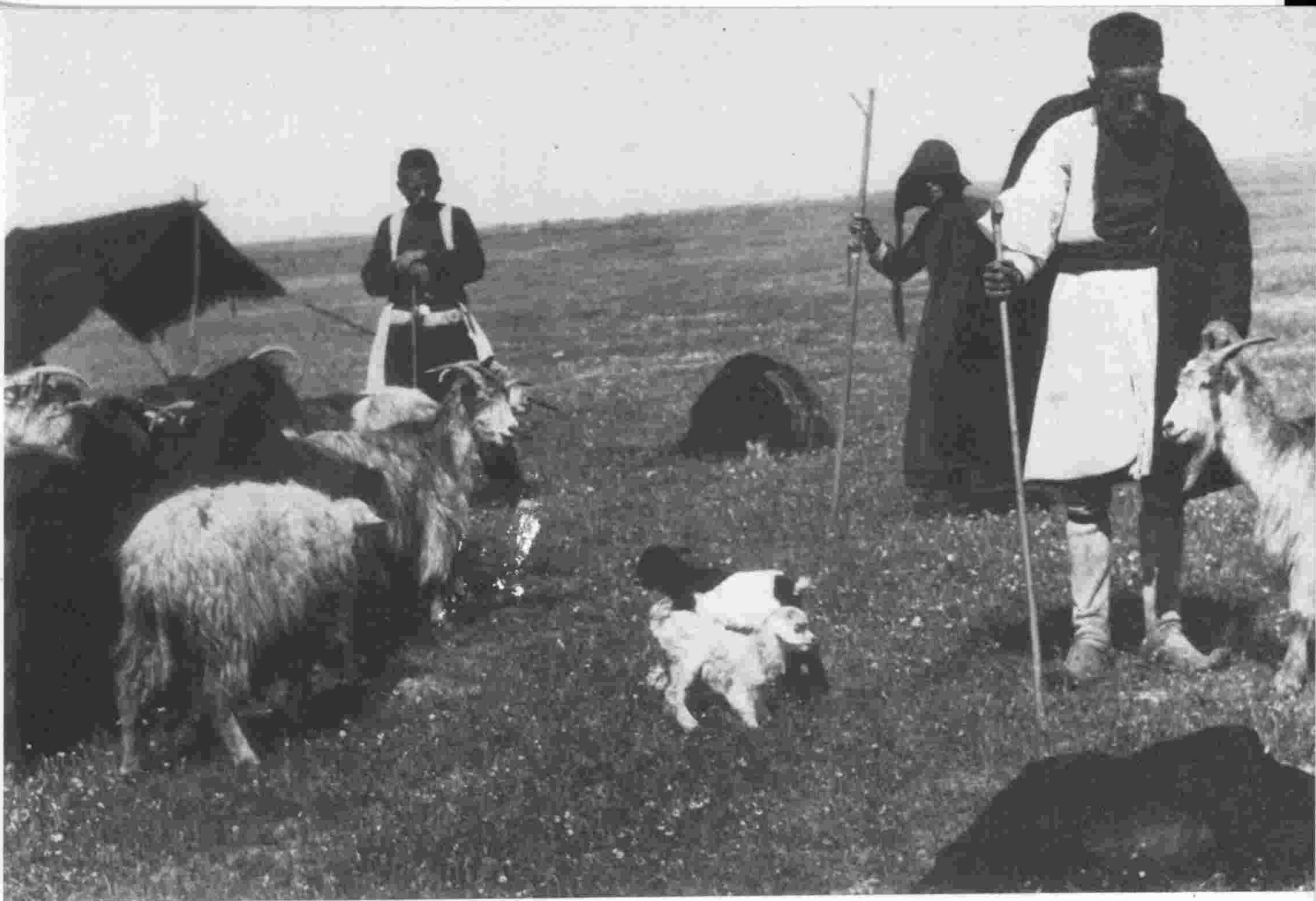
πρόχειρα τσαντήρια Σαρακατσανέων