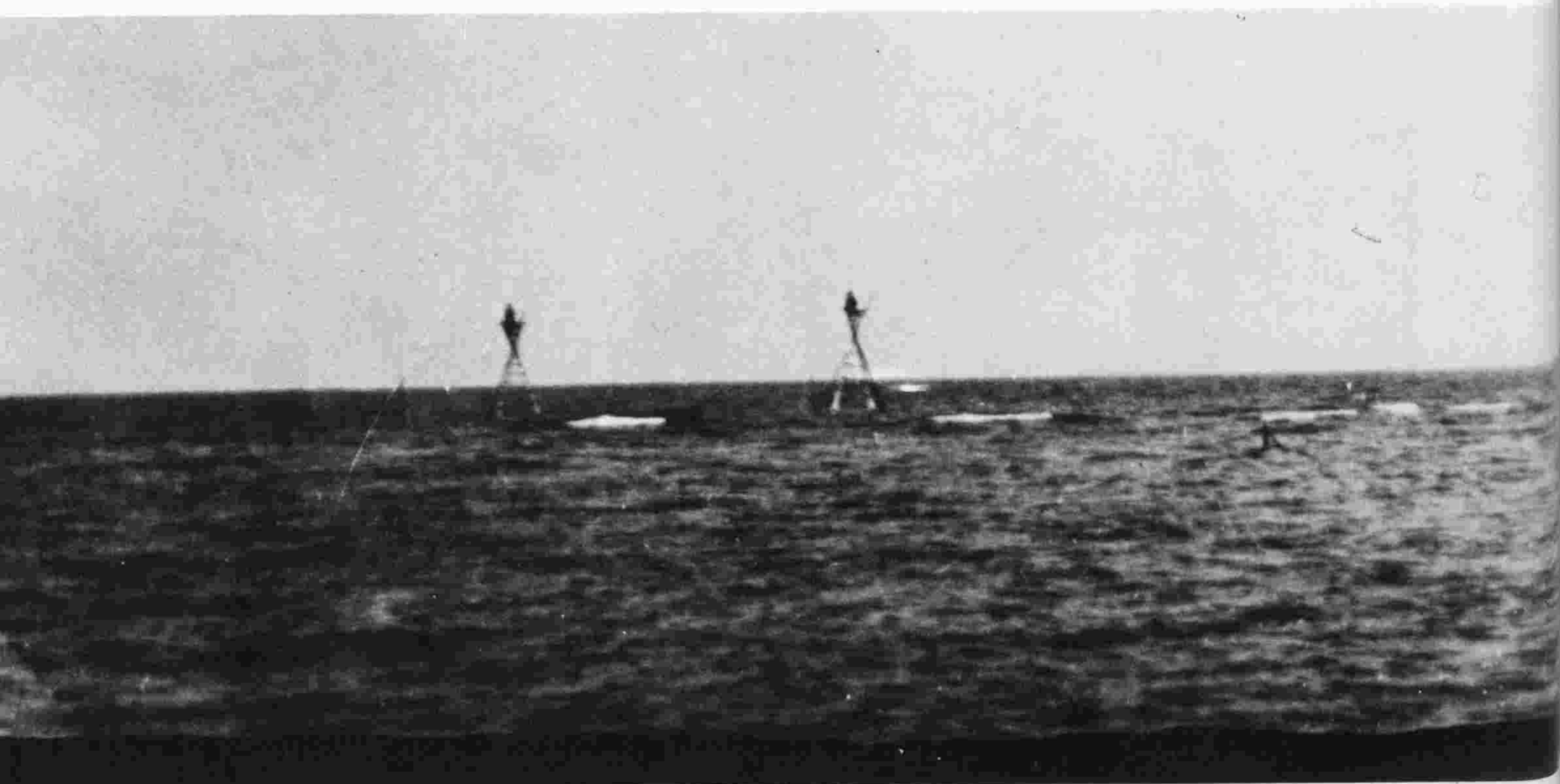
καρτέρια την άνοιξη ΧΑΛΚΙΔΙΚΗ