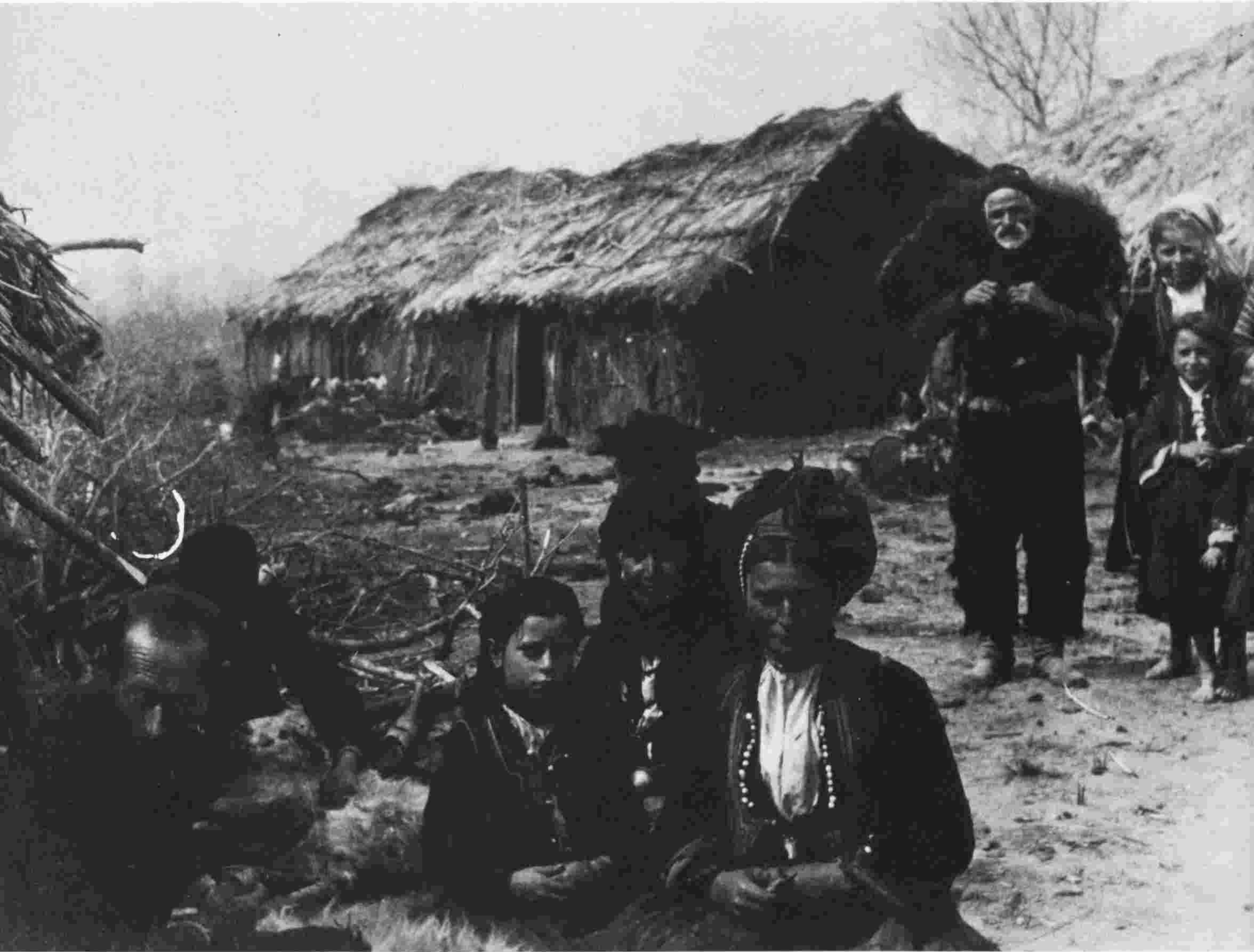
βλάχοι, μισονομάδες, ΣΙΔΗΡΟΚΑΣΤΡΟ