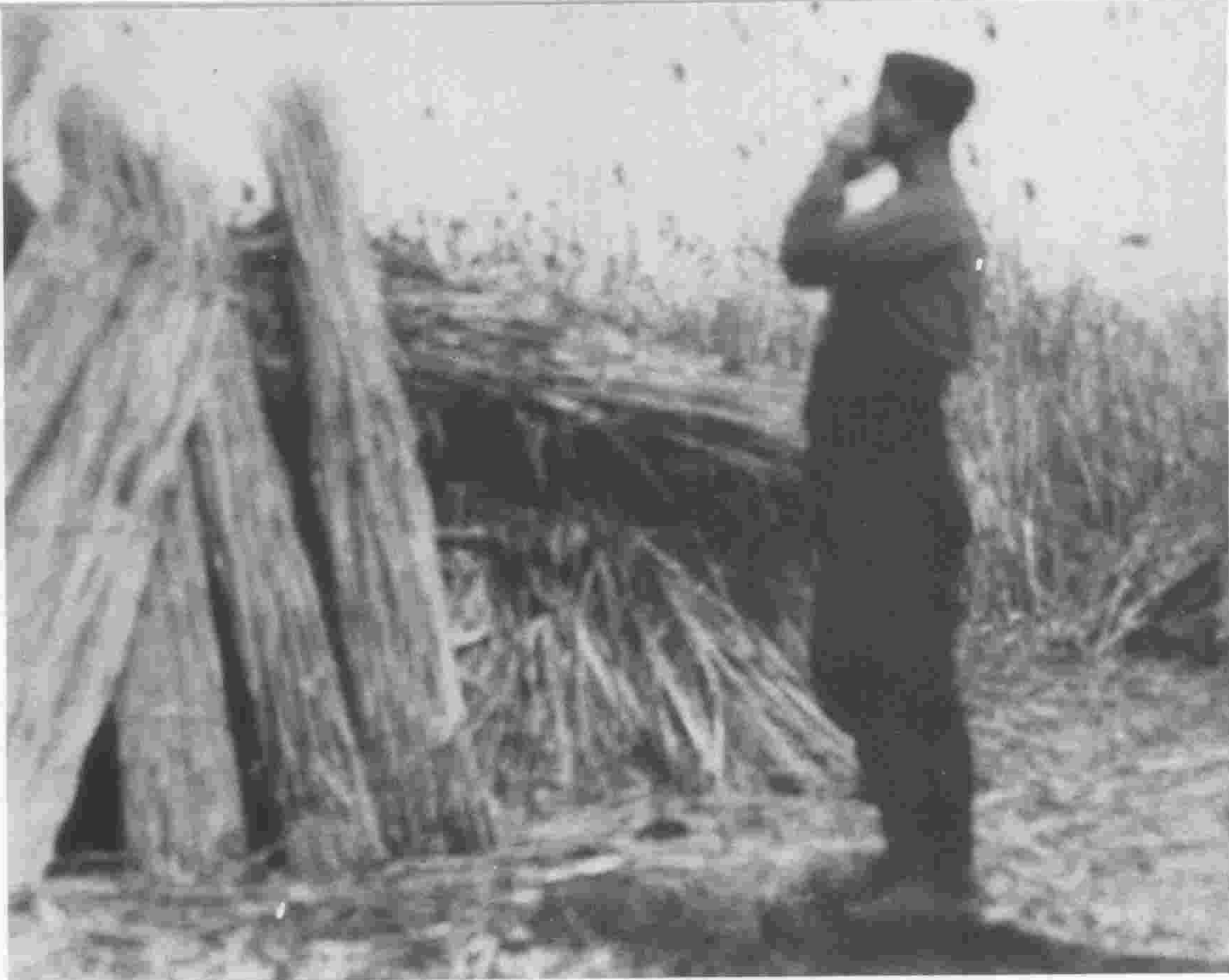
καλαμιώνες, «πλάβες» ΓΙΑΝΝΙΤΣΑ