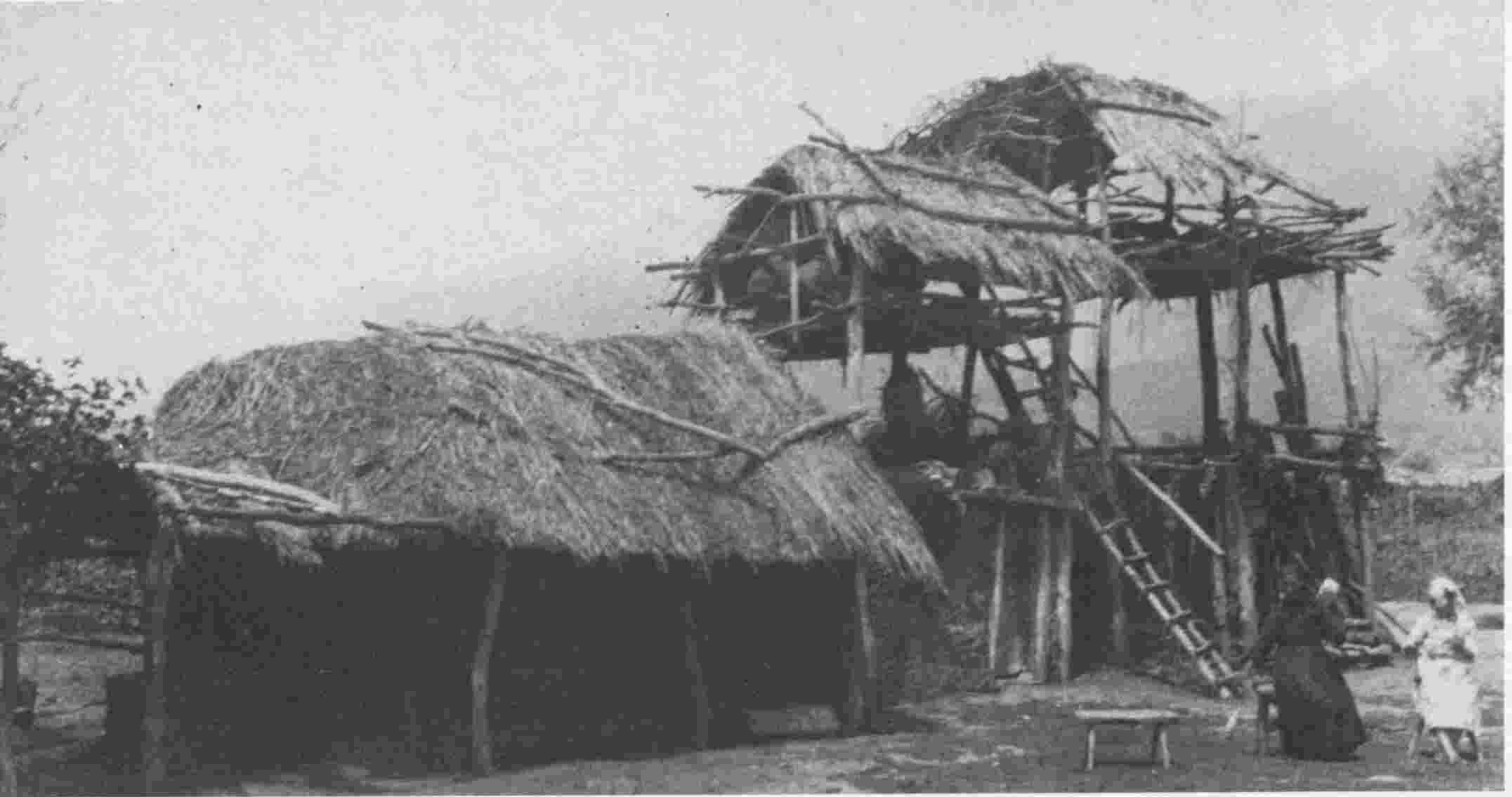
καλύβια ντόπιων κτηνοτρόφων ανατολική ΜΑΚΕΔΟΝΙΑ