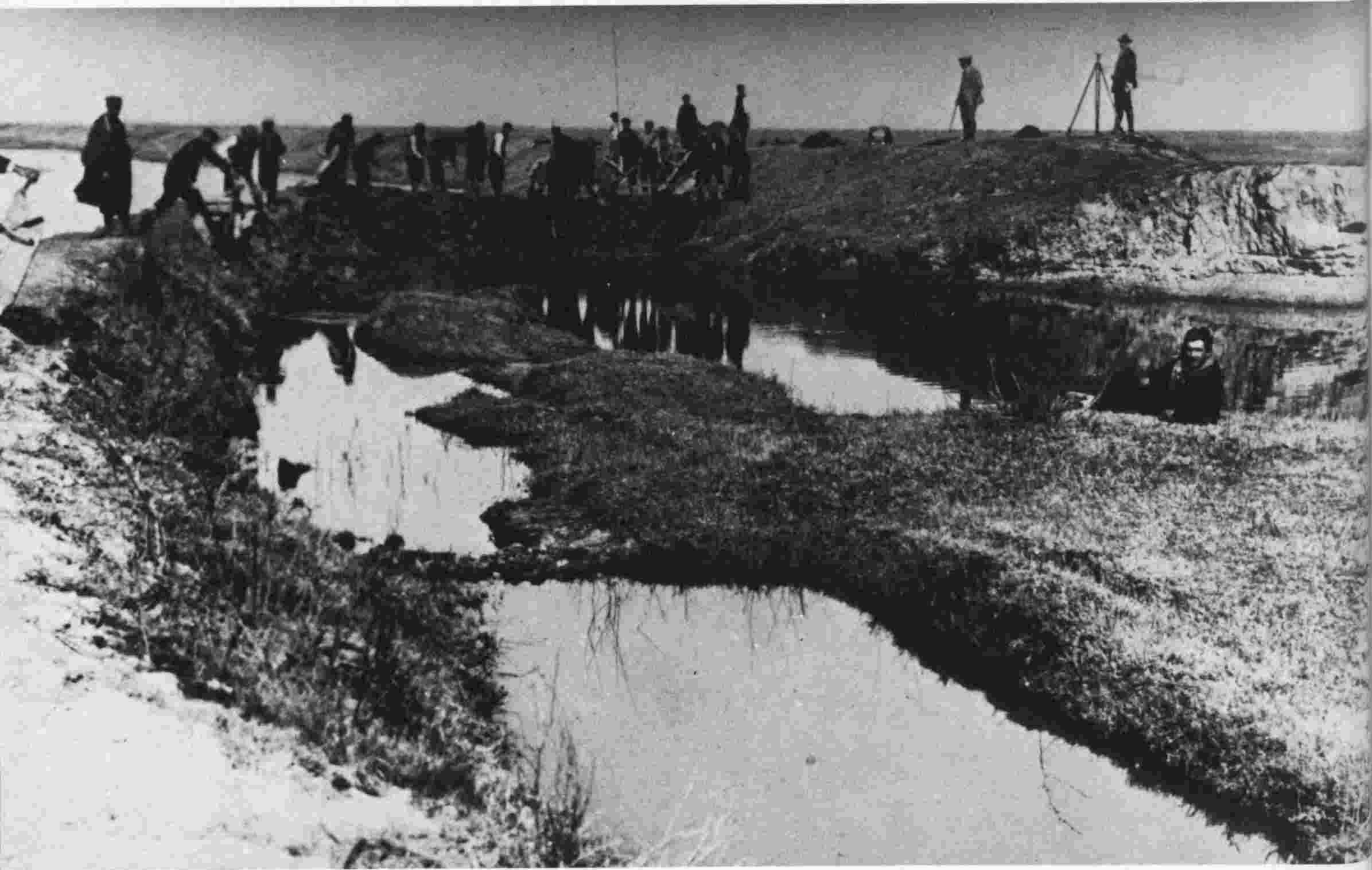
άναχωμα — βάλτα