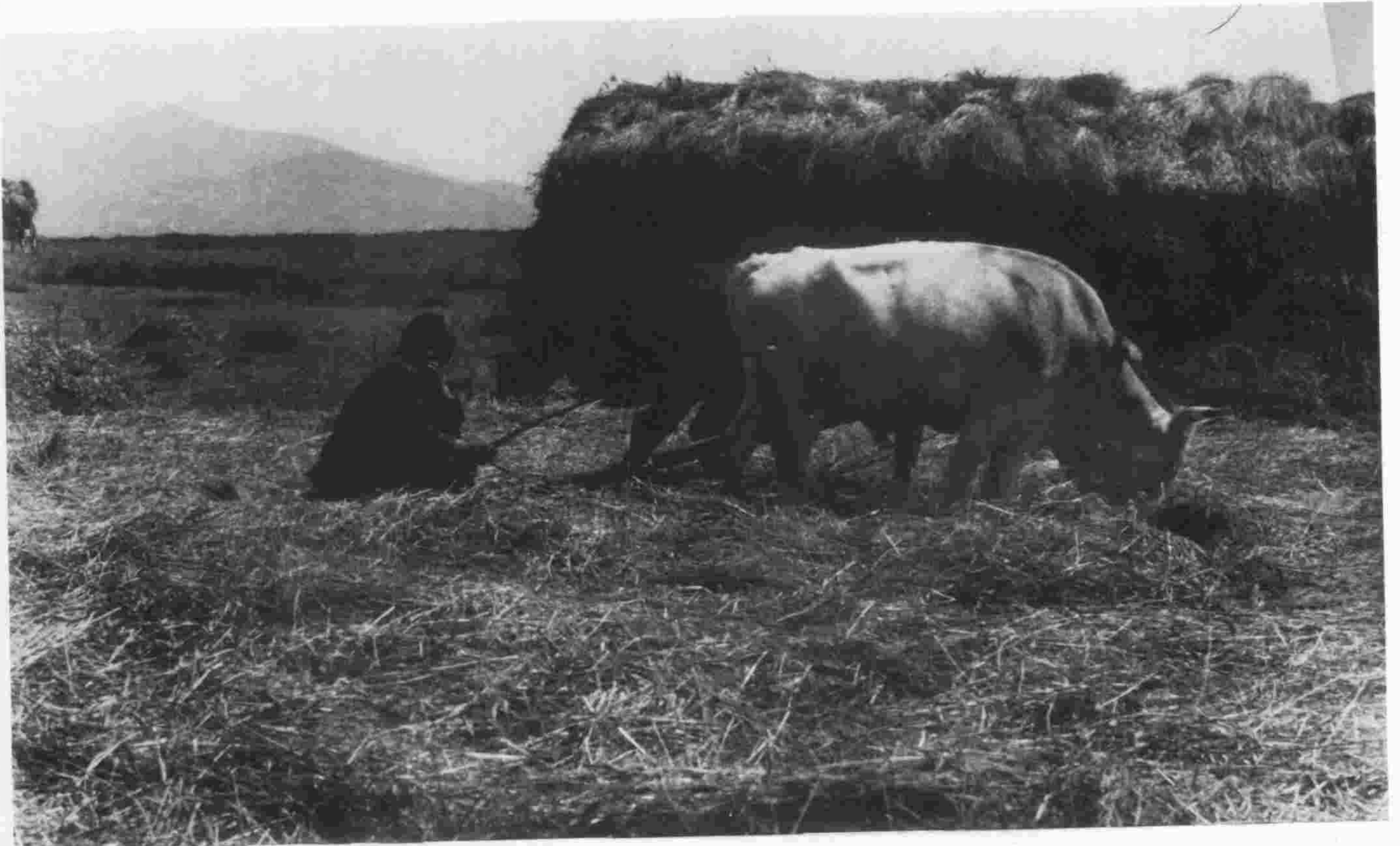
άλώνι — λυχνίσμα, ΧΑΛΚΙΔΙΚΗ