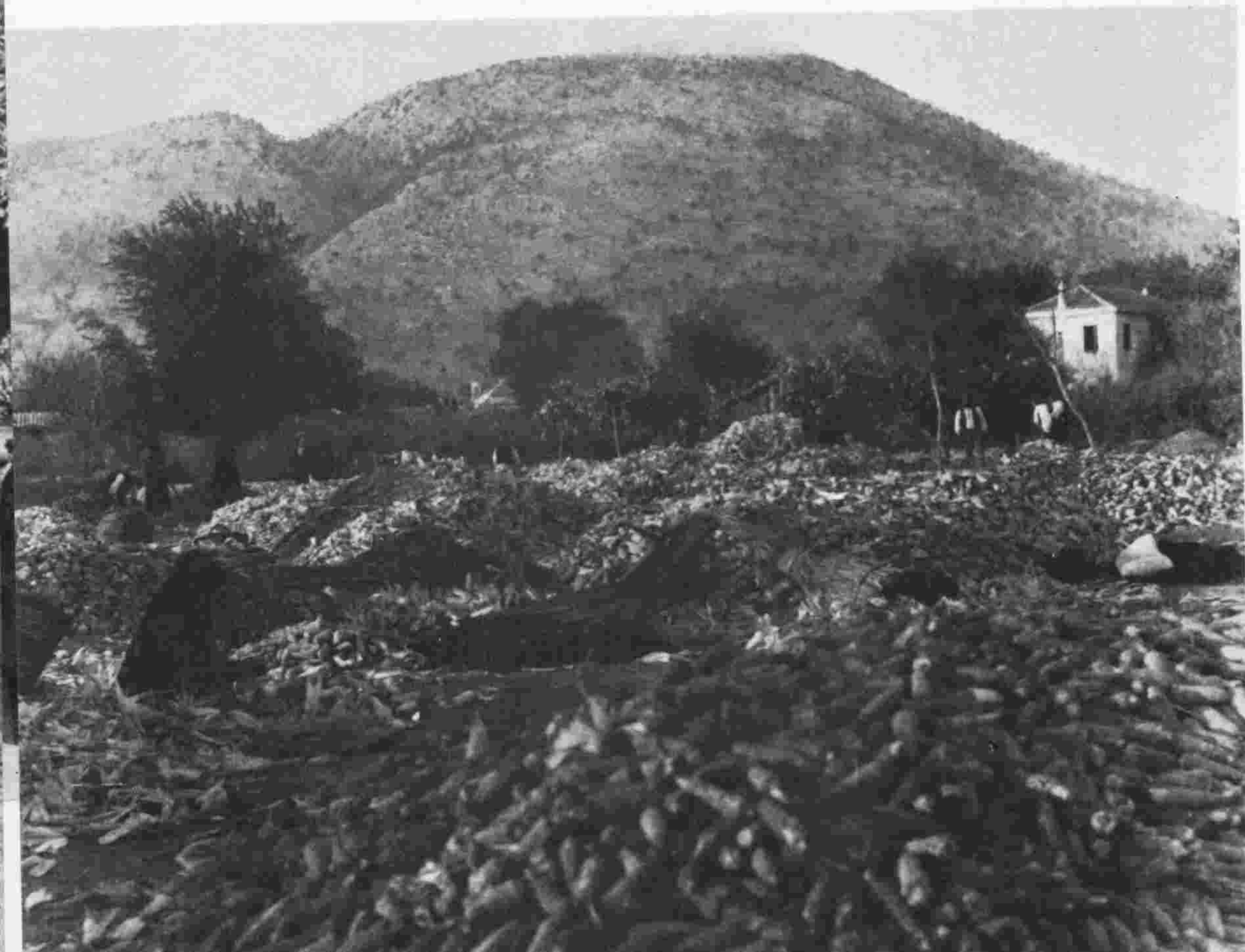
καλαμπόκι, ξεκόκκισμα ΦΙΛΙΠΠΙΑΔΑ