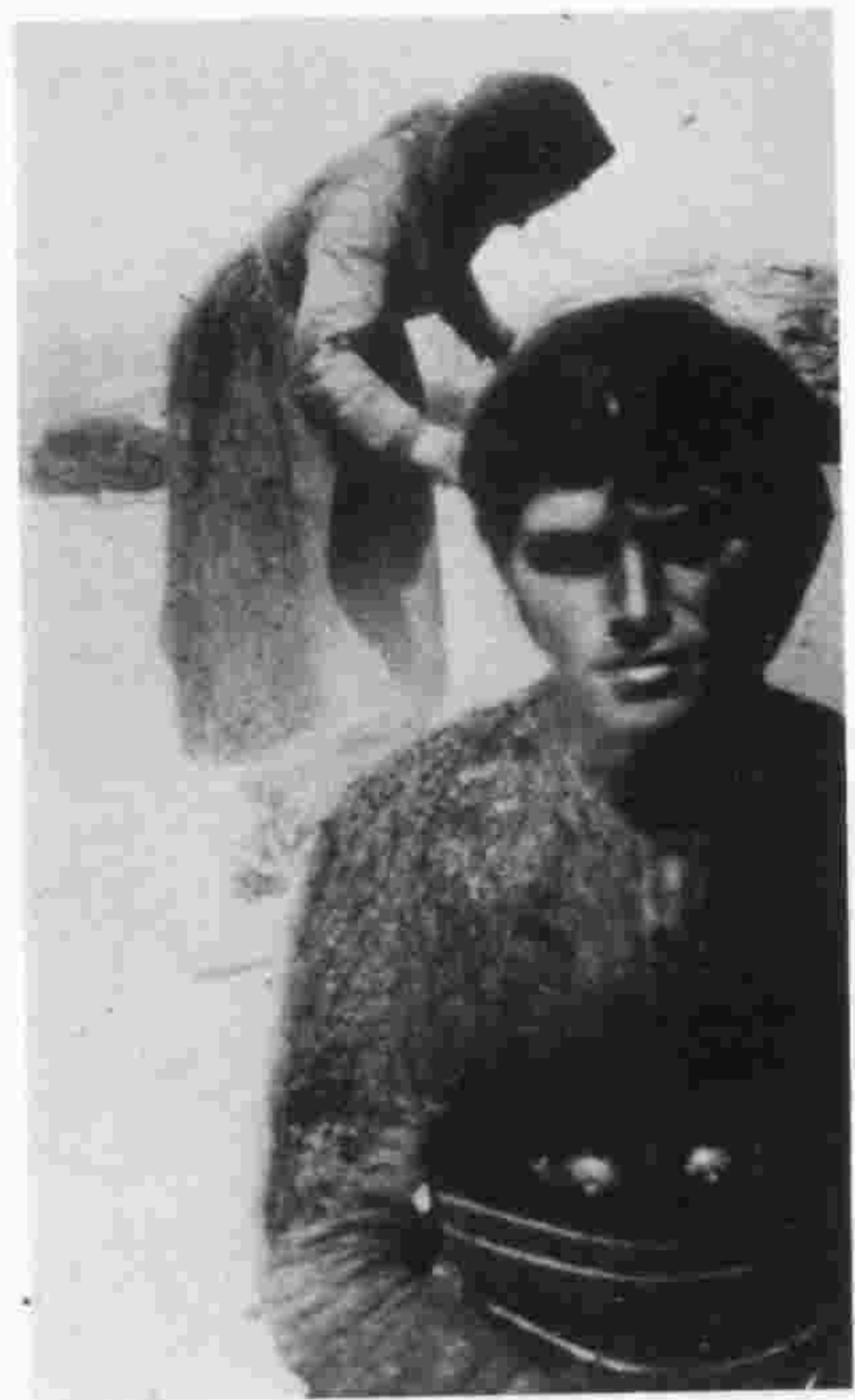
άντρες — γυναίκες