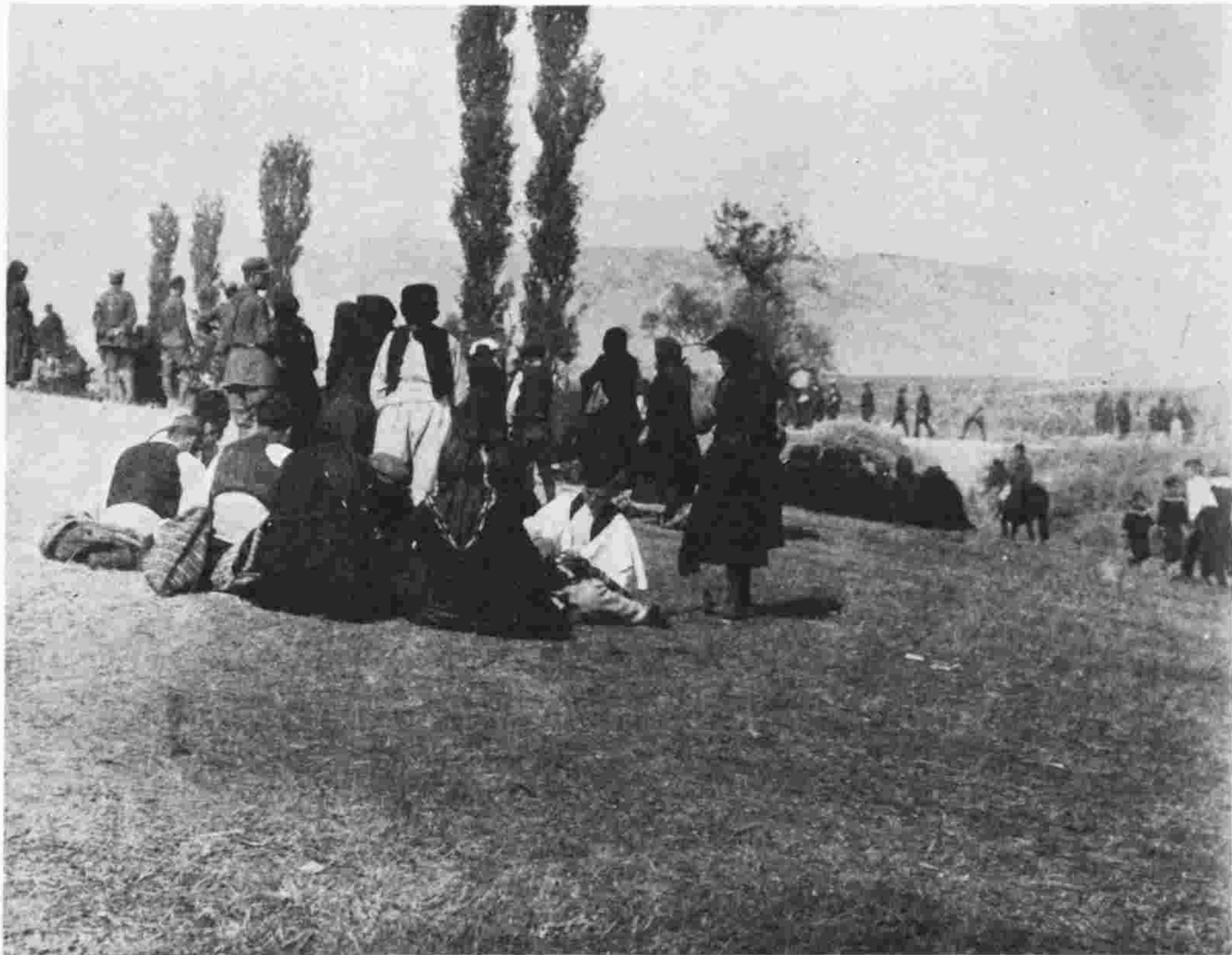
πανηγύρι, ἅη Γιάννη, ΜΠΟΥΝΙΛΑ