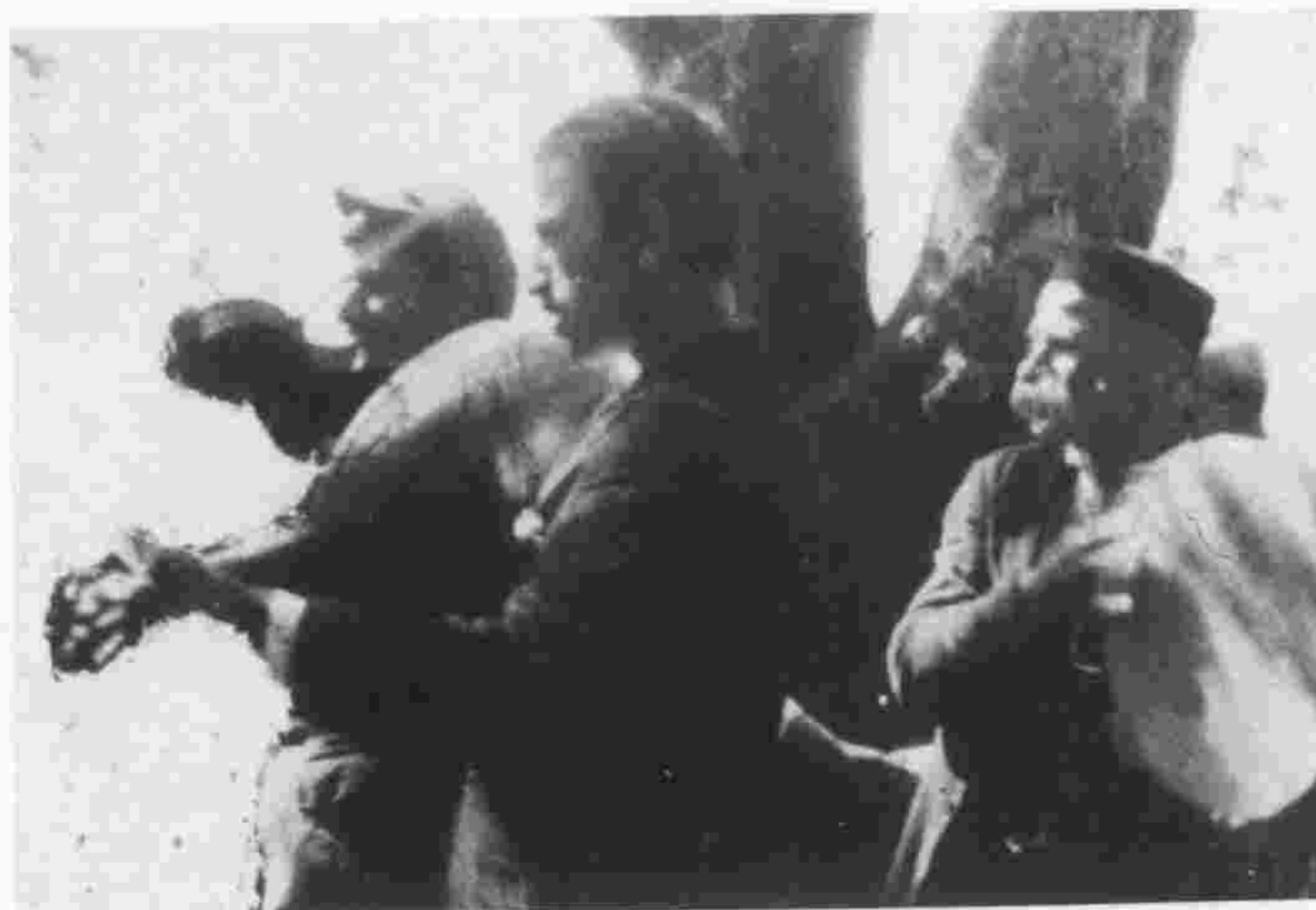
παζάρια – πανηγύρια