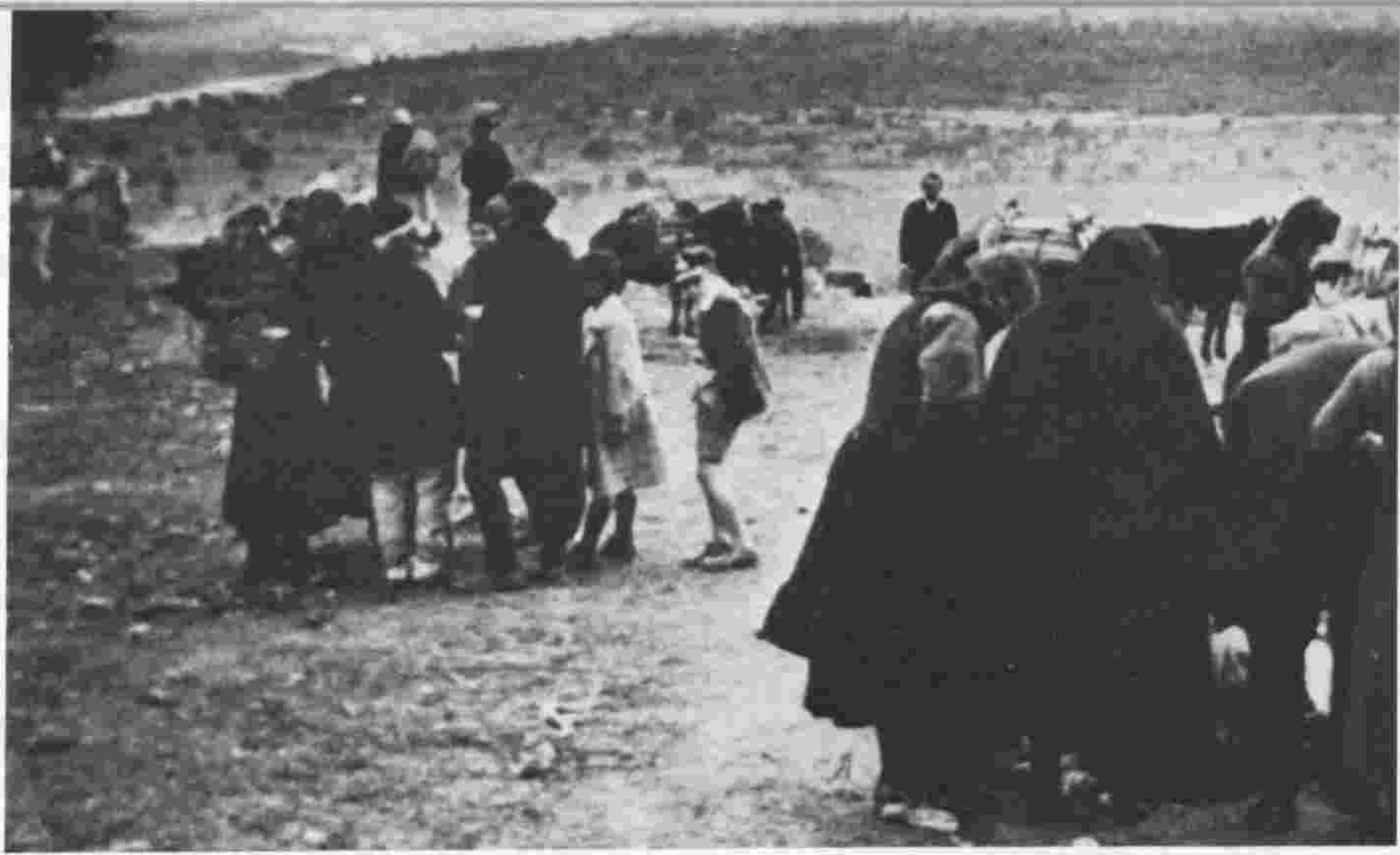
τό «παζαρόπουλο» 10 Ὀκτωμβρίου ΚΟΝΙΤΣΑ