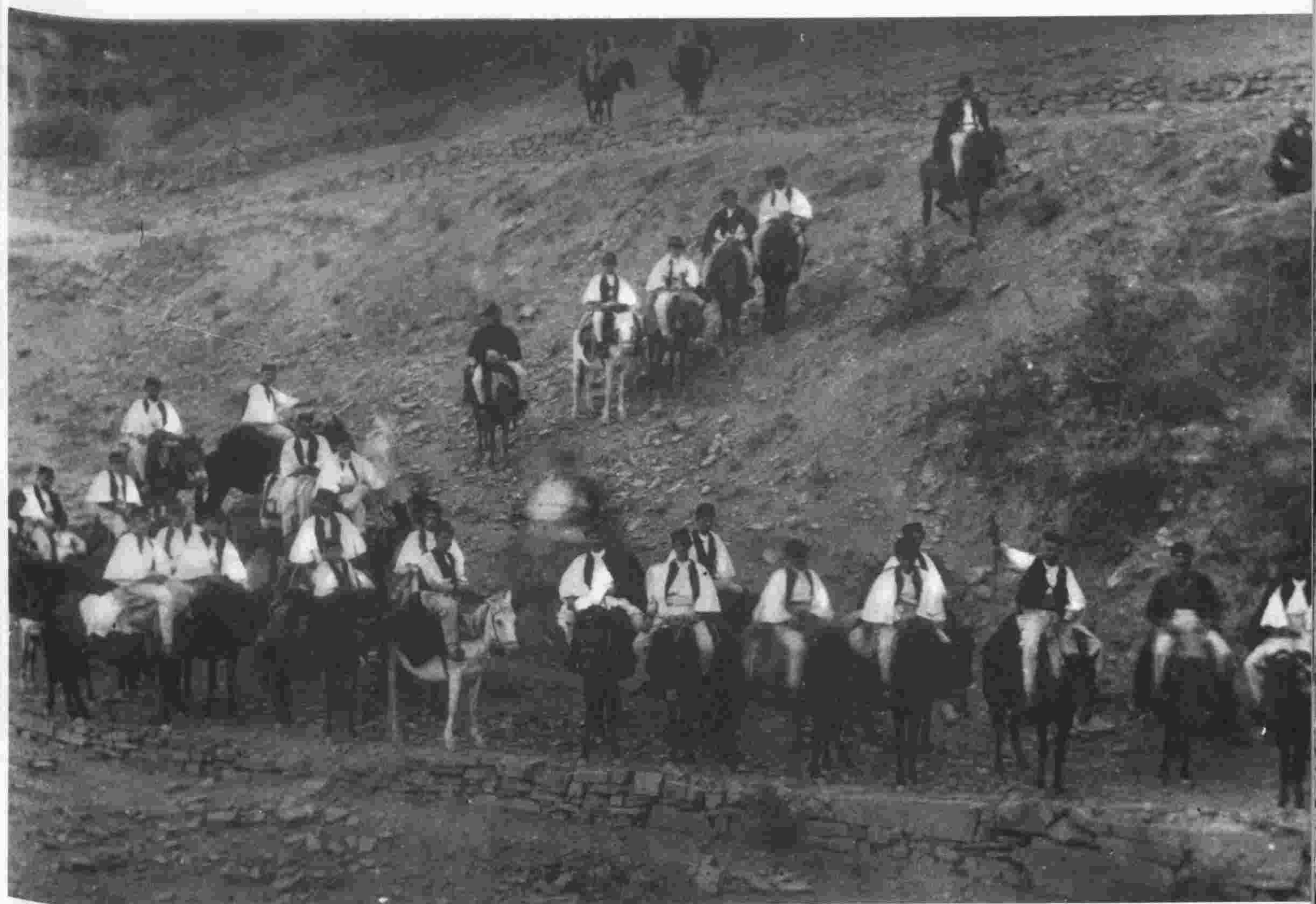
γάμοι, Σαρακατσάνοι καλεσμένοι άρβανιτόβλαχοι γαμπροί και νύφες