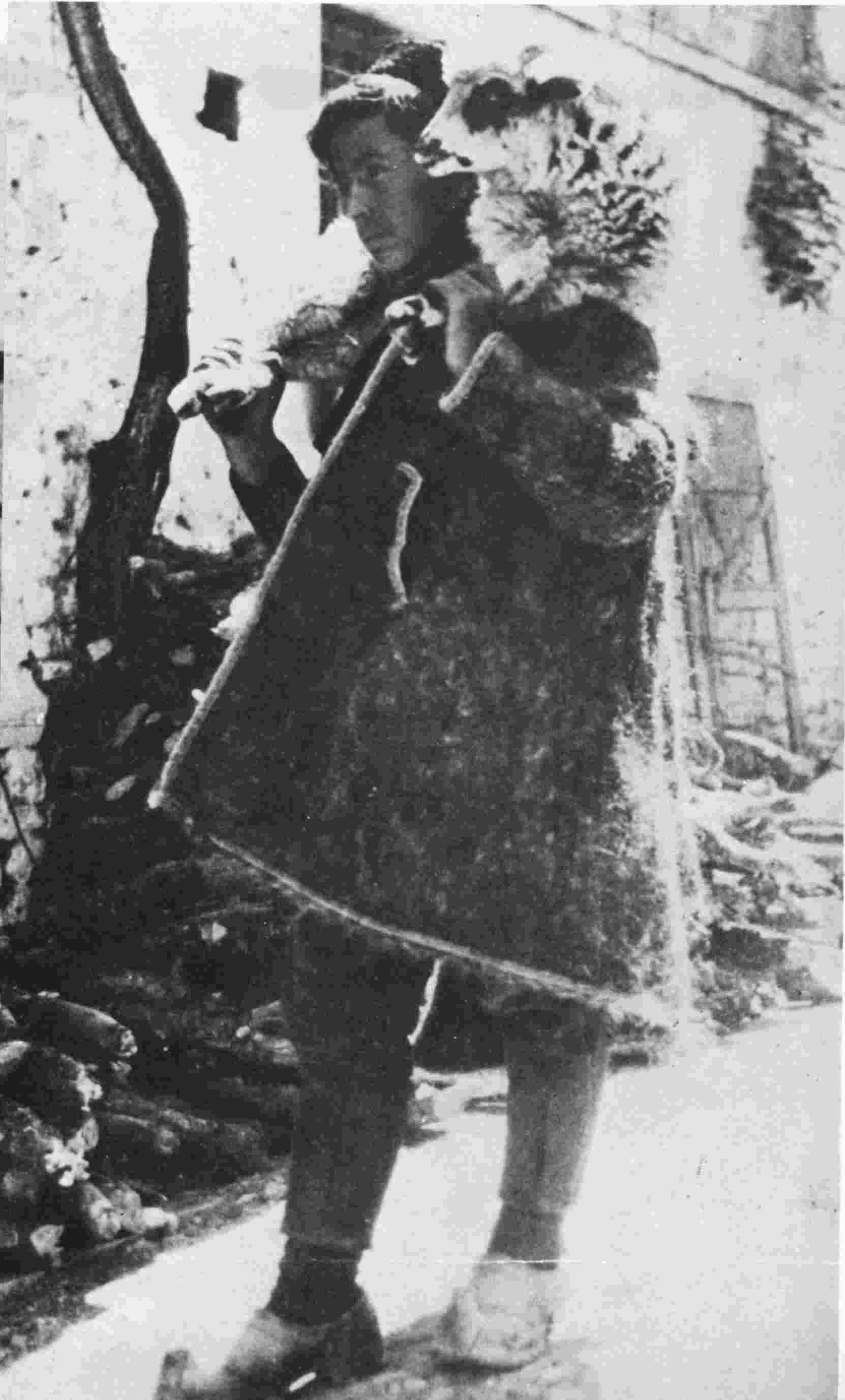
στό παζάρι, Πάσχα